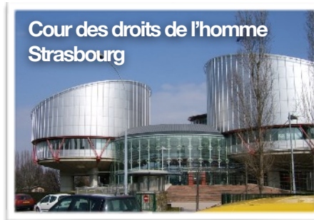
Cour des droits de l'homme Strasbourg

Le Pew Group, un centre de recherche américain, a découvert que les Chrétiens étaient harcelés pour leur foi plus que tout autre groupe religieux. Et selon une revue indépendante pour le Bureau britannique des Affaires étrangères et du Commonwealth (United Kingdom's Foreign and Commonwealth Office), il est estimé que 245 millions de Chrétiens ont fait face à une persécution significative en 2018, une augmentation de 30 millions par rapport à l'année précédente.