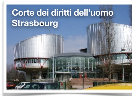
Corte dei diritti dell'uomo Strasbourg

Il Pew Group, un centro di ricerca americano, ha scoperto che i cristiani sono molestati per la loro fede più di ogni altro gruppo religioso. E secondo una rivista indipendente per l'ufficio britannico degli affari esteri e del Commonwealth (United Kingdom's Foreign and Commonwealth Office), è stimato che 245 milioni di cristiani hanno fronteggiato una persecuzione significativa nel 2018, una crescita di 30 milioni rispetto all'anno precedente.