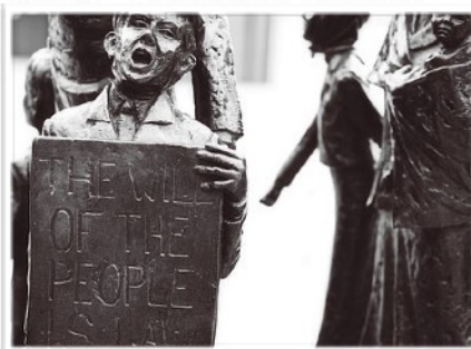
'La volonté du peuple est loi'

Qu'est-ce qui lui est bon et agréable ? La réponse, selon 1 Tim. 2:4, est « que tous les hommes soient sauvés et parviennent à la connaissance de la vérité en Christ. » La salut, c'est le cœur de l'Évangile. Comment pouvons-nous soutenir cette bonne volonté de Dieu ? Paul ne dit pas « allez et évangélisez », mais créez le cadre politique pour l'évangile : une « vie paisible et tranquille... marquée par la piété et la dignité. » Ce que cela signifie est une société socialement satisfaite, dans laquelle la liberté religieuse et la dignité humaine prévalent (dans le langage actuel). Pour que ceci se produise, nous devons prier (V2a) pour les décideurs de l'Etat, à l'époque les rois, aujourd'hui les politiciens élus démocratiquement. Etant donné que la démocratie, en tant que forme d'Etat, garantit évidemment les meilleures conditions pour l'évangile dans le monde entier, œuvrons et prions pour sa préservation en Europe. « Car ceci est bon et agréable à Dieu. »